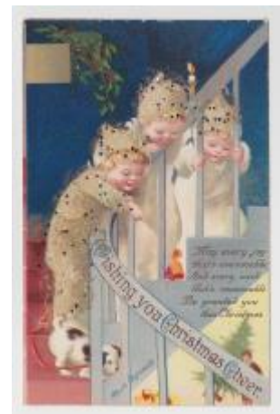
I Julkort signerat Ellen Clappsaddle

Svenska Vykortsföreningen har sen sist deltagit med bord på Norrtäljemässan och själva arrangerat Valbomässan den 30 september.