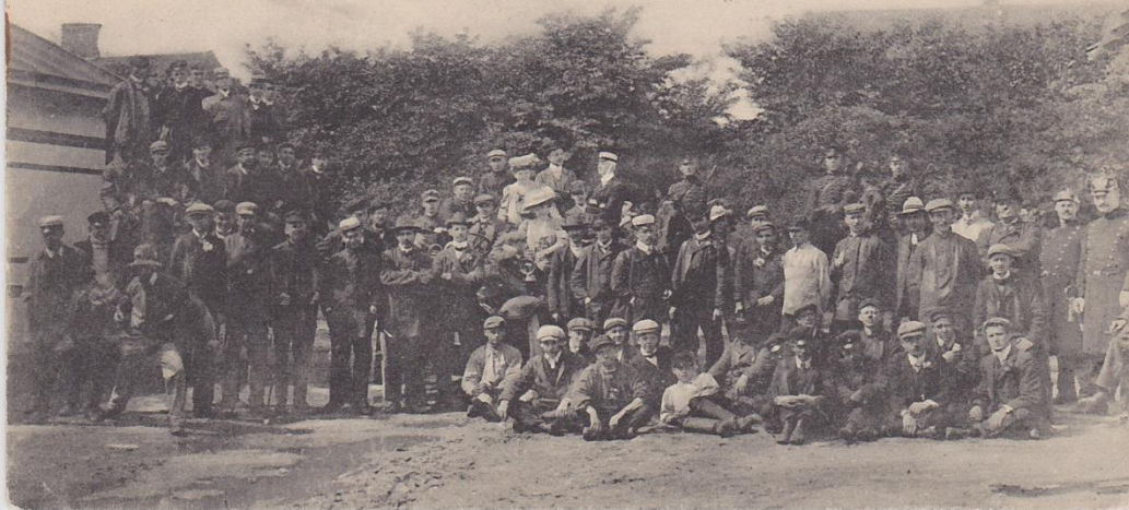
Kommunalarbetarstrejken i Malmö 1908. (Renhållningsverket). De frivilligas frukostrast.

Att LO lämnade kvinnorna bakom sig betydde inte att stridsämnen saknades. 1908 organiserades en kommunalarbetarstrejk i Malmö. Tro inte att den välklädda skaran är de strejkande!