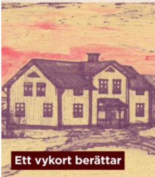
Ett vykort berättar