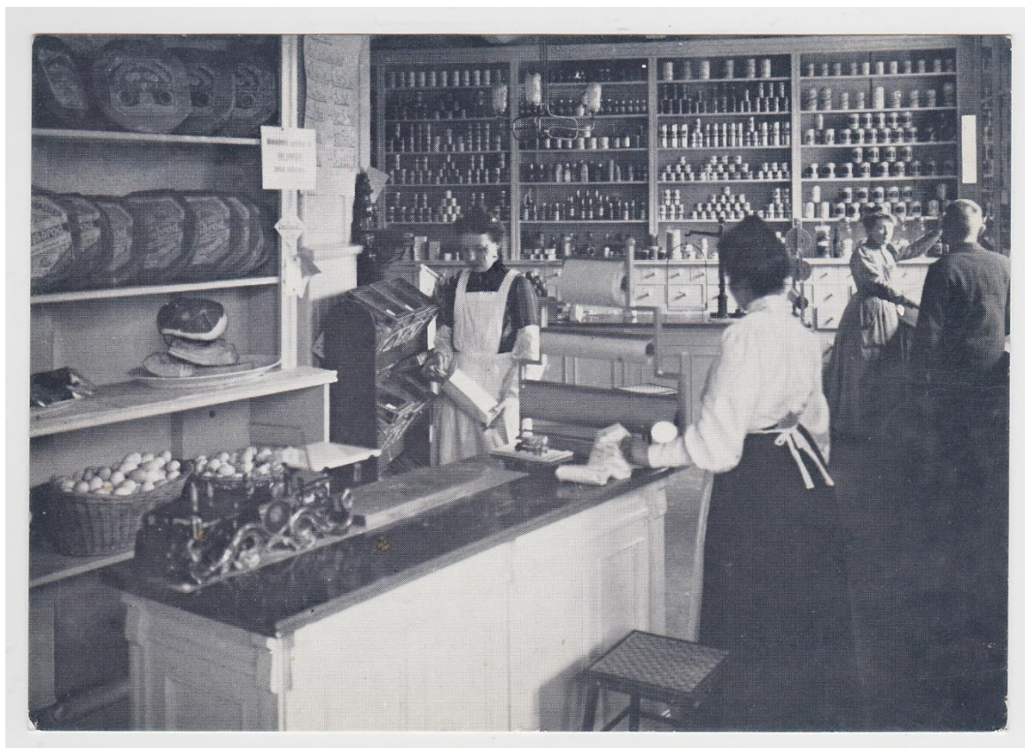
Expediering hos affärsföretaget Svenska hem. Foto 1906. Vykort i A6-format utgivet av Handels avd. 20 – 60 år.