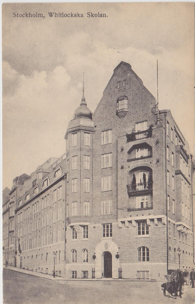
Stockholm, Whitlockska Skolan.

1913 flyttade skolan in i det nybyggda skolhuset på Eriksbergsgatan 8A efter arkitektfirman Hagström & Ekmans ritningar. Vykort utgivet av SVENSKA LITOGRAFISKA AB STOCKHOLM.