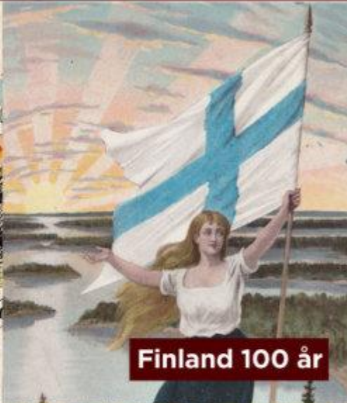
Finland 100 år