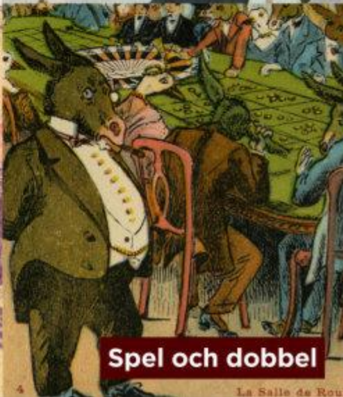
Spel och dobbel

Ingen framsida från 2018 än: det här var 2017/4!