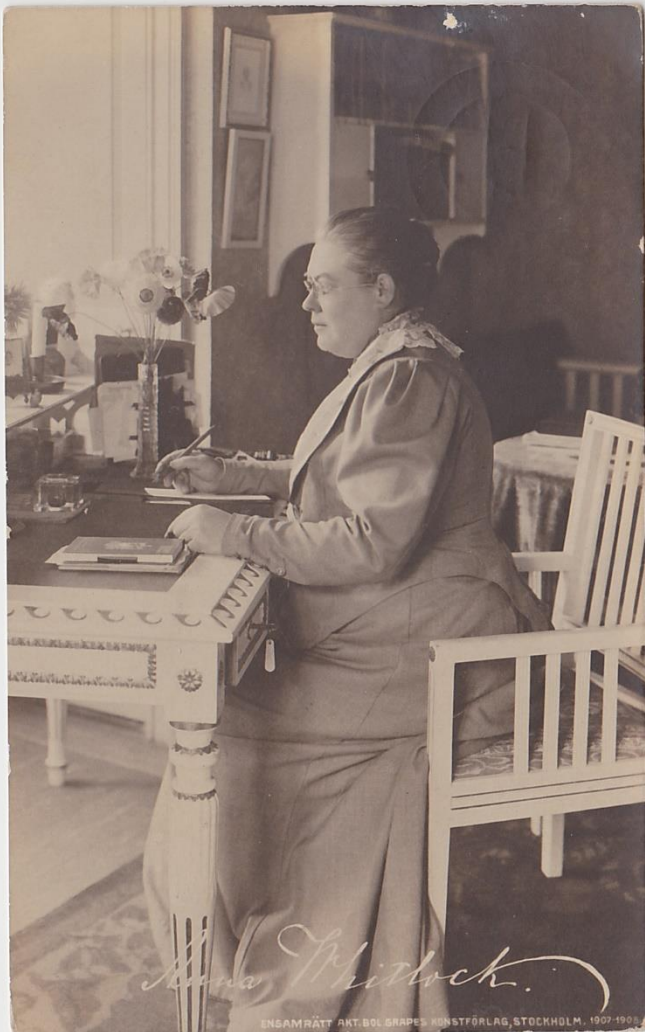
Anna Whitlock. Ur en serie vykort med kulturpersonligheter utgiven 1908-09.

Där lärde vi oss att kvinnan som inspirerat till fröken Friman i serien var Anna Whitlock. Till skillnad mot fröken Friman i TV-serien hade fröken Whitlock en mycket mer omfattande gärning än bara Svenska hem.