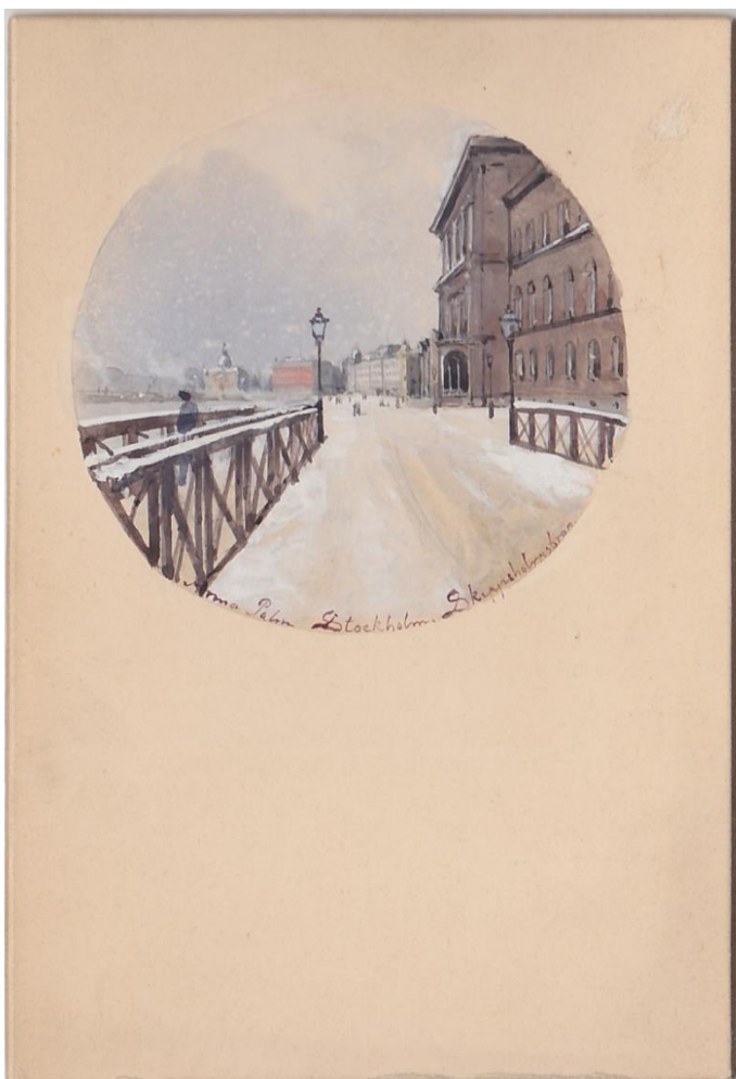
Ett av SvDs "dyra handmålade" julkort av Anna Palm från 1886? Signerat men inte daterat.

1889 hittar jag enskilda tidningsnotiser med svenska konstnärers julkort men 1890 verkar det lossna.