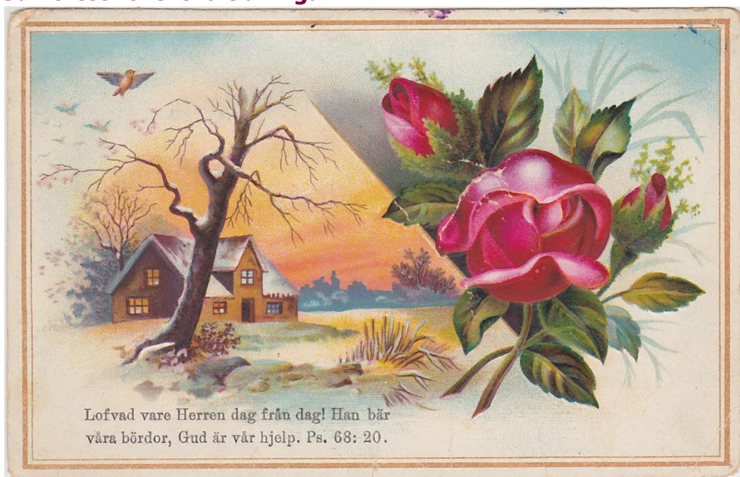
Relieftryckt kromolitografiskt julkort med blank baksida och noteringen 1887 (ej vykort)

Med 30 miljoner kronor från forskningsstiftelsen Arcadia, en välgörenhetsstiftelse grundad av Lisbet Rausing och Peter Baldwin, kan Kungliga biblioteket (KB) och Riksarkivet digitalisera hela återstoden av det svenska pressarvet. 2022 kommer samtliga svenska dagstidningar från åren 1734–1906 att finnas tillgängliga på nätet.