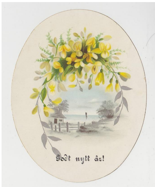
Ovalt "Godt nytt år!"-kort med skriven hälsningstext och årtal 1889 på blank baksida

De tidiga korten hade inte tomten som fokus. De från England importerade korten hade alla slags motiv, ofta blommor eller naturscenerier, men det skrivs också om applikationer alla slags material, tex "kvistar och löf från det heliga landet".