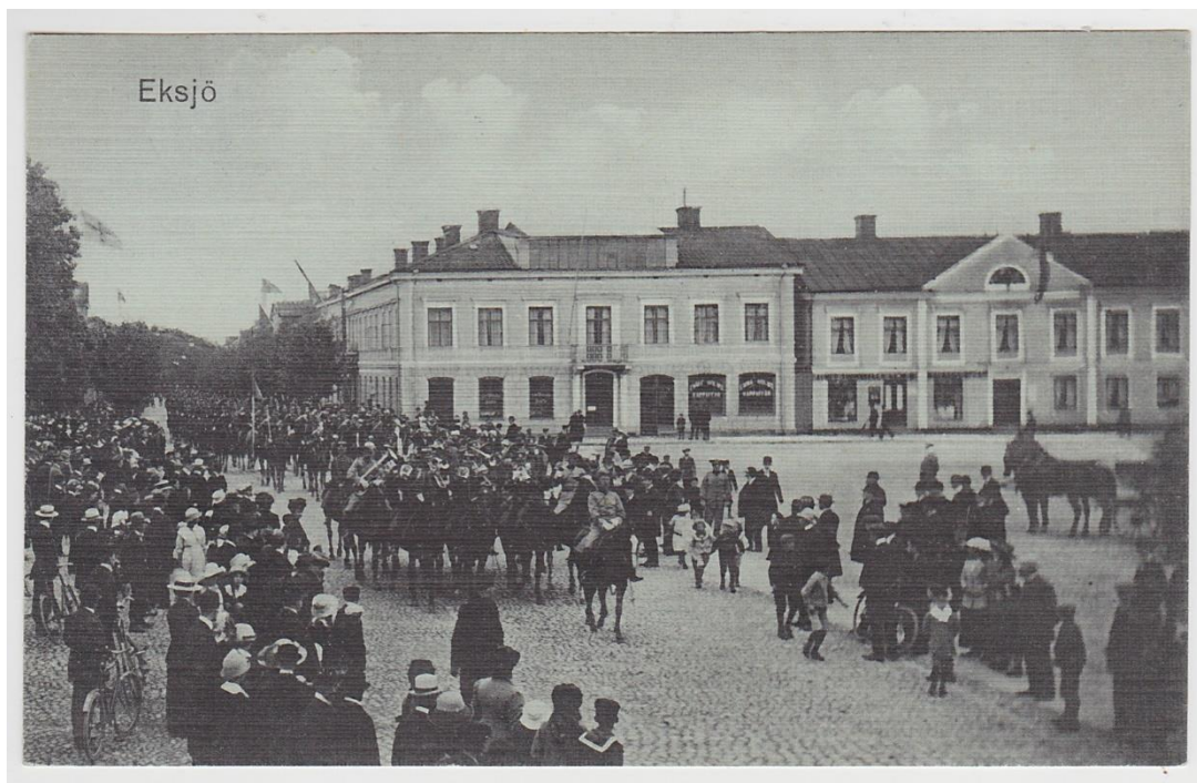
Smålands husarer, K4, på Eksjö torg, när regementet fortfarande var aktivt ca 1915